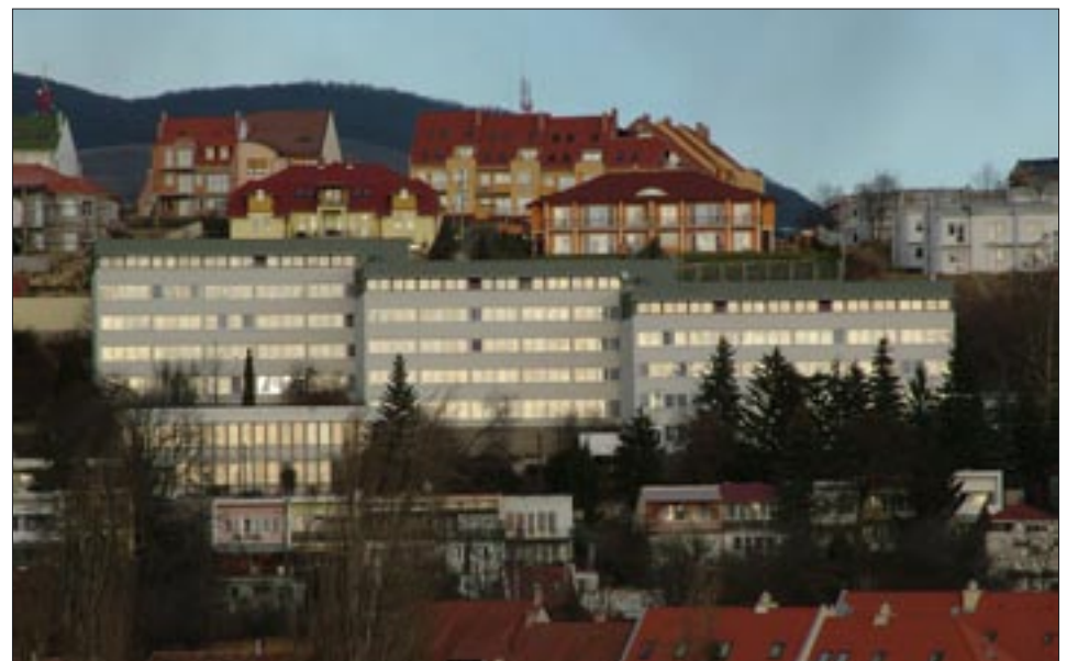
Az Almágyar-dombi városrész