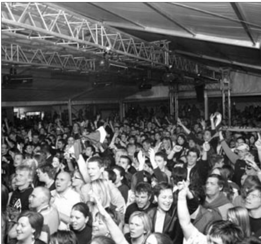
egri Főiskolás Napok – Egy hét együtt, Veled, Neked!

– A. P.: Nagyon szeretem Eger, mert nagyon szép kis barokk város, és kulturáltak az emberek. Amikor az első házibulin voltam Egerben, akkor anyám megkérdezte: „Petikém, ugye milyen szépek az egri lányok?” És valóban! Itt voltak a törökök nagyon sokáig, és ezért van egy nagyon érdekes genetikai módosulás az egriekben, itt nagyon szép csajok vannak, nagyon huncut szeműek, nagyon bübajosak.