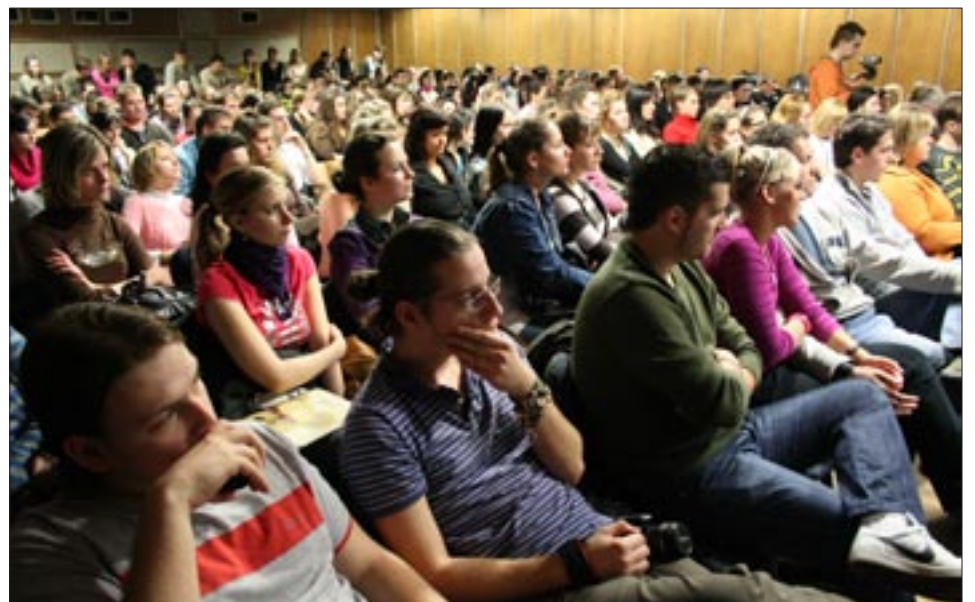
Tömött előadó egy-egy érdekes előadáson