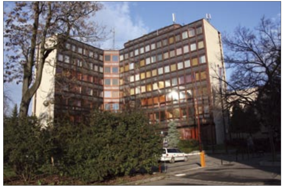
„B” épület – üvegpalota – a GTK székhelye, bölcsész szakok