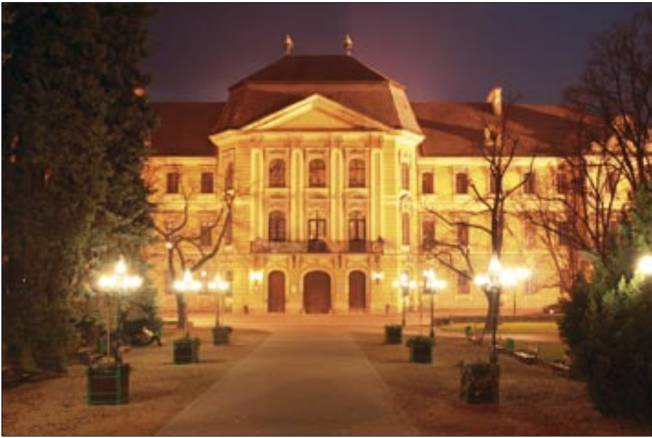
Bölcsház az... a Bölcsészettudományi Kar, „A” épület