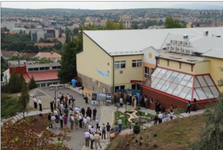
Egy C-petnyi varázslat – természettudományi szakok