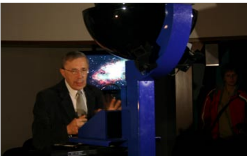
Planetáriumi előadás a Varázstoronyban, a Líceumban