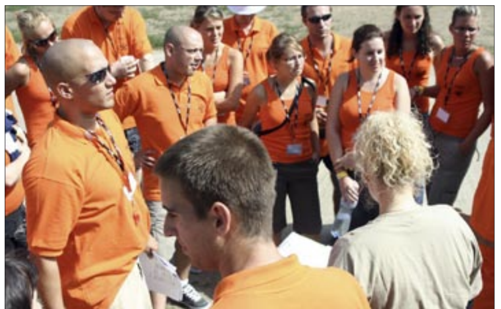
Gólyatábor: ...a rókák hada készen áll...