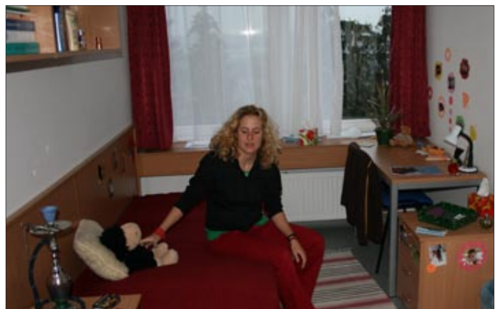
A szakkoli egy szakkollissal