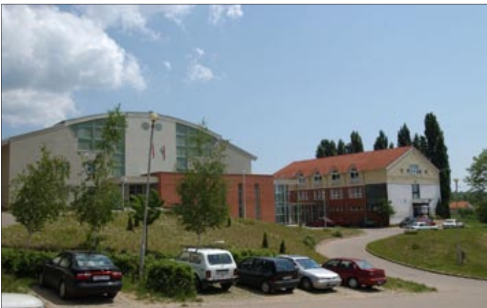
Ép testben, ép lélek – a sportcsarnokok