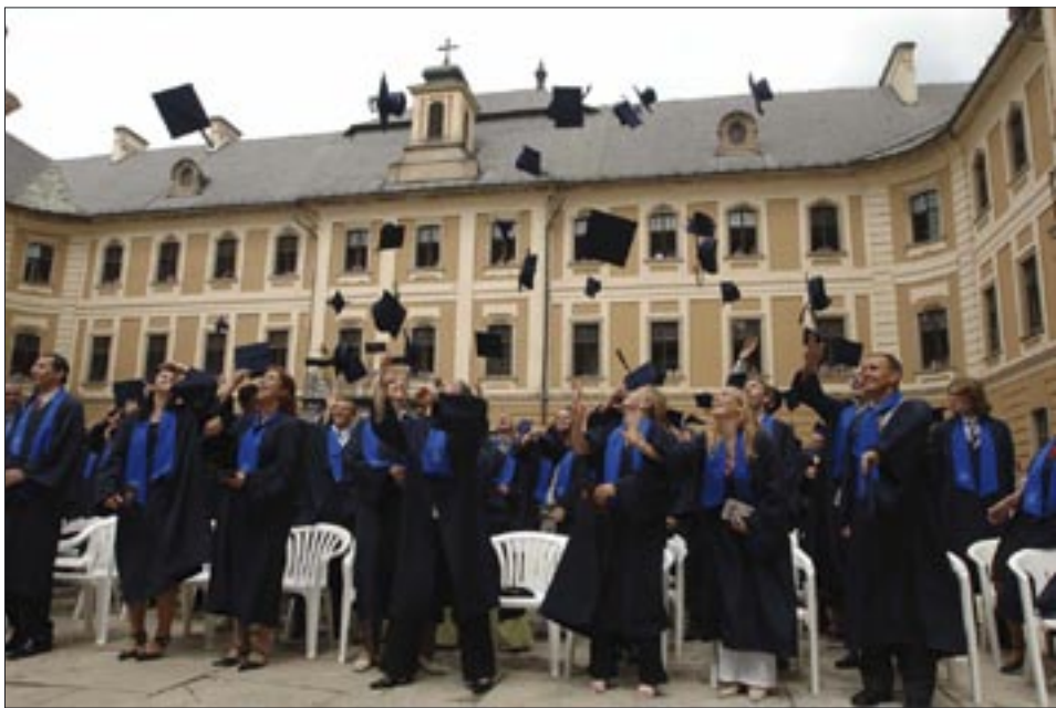
A hön áhított pillanat – diploma a kézben, magisztersapka a levegőben