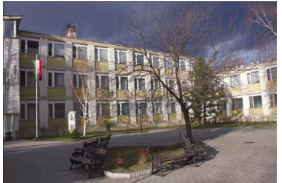
A tanárképzés gyakorlati helye